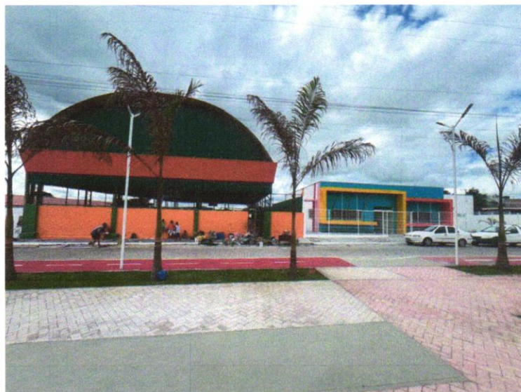
Foto 02 - PAVIMENTAÇÃO EM CONCRETO, COM ESPESSURA DE 7 CM, COM ACABAMENTO FEITO UTILIZANDO ALISADORA DE CONCRETO (HELICOPTERO), INCLUIDO TELA DE AÇO SOLDADA NERVURADA CA60, Q196 (3,11 KG/M 2 ), DIAMETRO DO FIO 5.0 MM, LARGURA = 2,45 M, ESPAÇAMENTO DA MALHA = 10 X 10 CM, JUNTA DE DILATAÇÃO EM PVC A CADA 2,00 M, CONCRETO FCK = 20 MPA