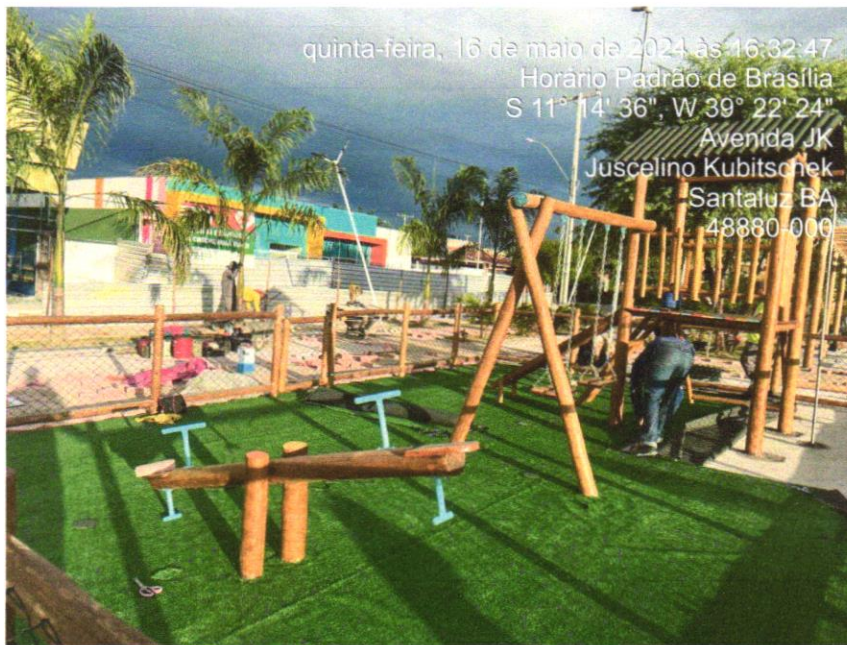
Foto 05 - Fornecimento e assentamento de Casinha do Tarzan em eucalipto tratado, com pântico de um balanço