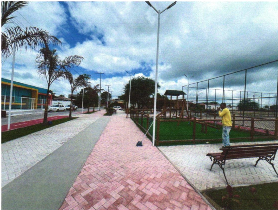
Foto 09 - Banco de madeira com encosto em eucalipto tratado (2,00X0,50)M