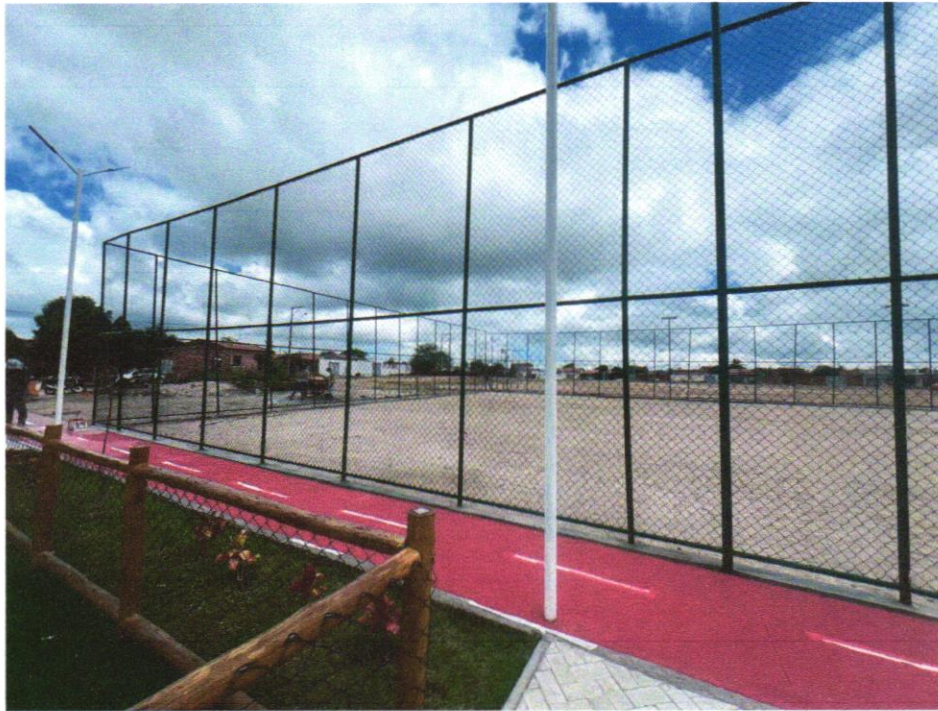
Foto 15 - Poste decorativo 2 pétalas, em aço galvanizado com difusor em vidro transparente temperado, com 3m/4m, inclusive lâmpada de led 50w