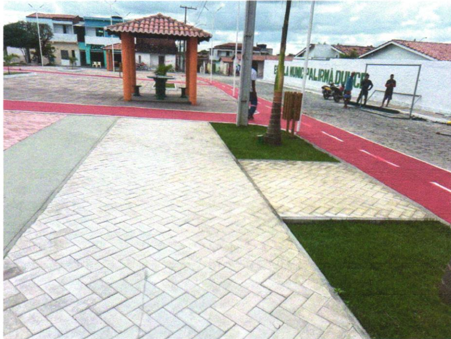
Foto 03 - Pavimentação em bloco de concreto vibroprensado, intertravado, cor natural, 10x20cm, e=6cm, 46un/m2, NBR9781, Fck(min)=35MPa, sob coxim areia grossa compactada c/ placa vibratória, e(comp.)=6cm, rejuntado c/ areia fina.