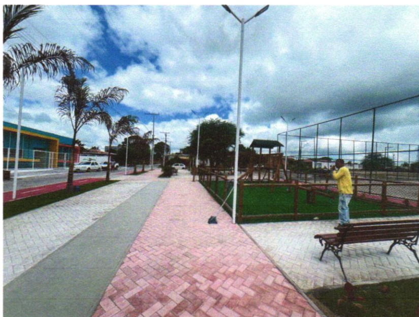
Foto 14 - Poste decorativo 2 pétalas, em aço galvanizado com difusor em vidro transparente temperado, com 3m/4m, inclusive lâmpada de led 50w