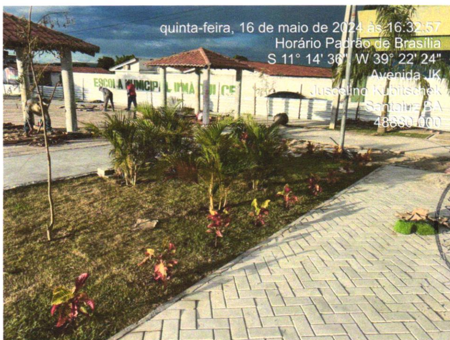
Foto 12 - FORNECIMENTO E PLANTIO DE VEGETAÇÃO ORNAMENTAL