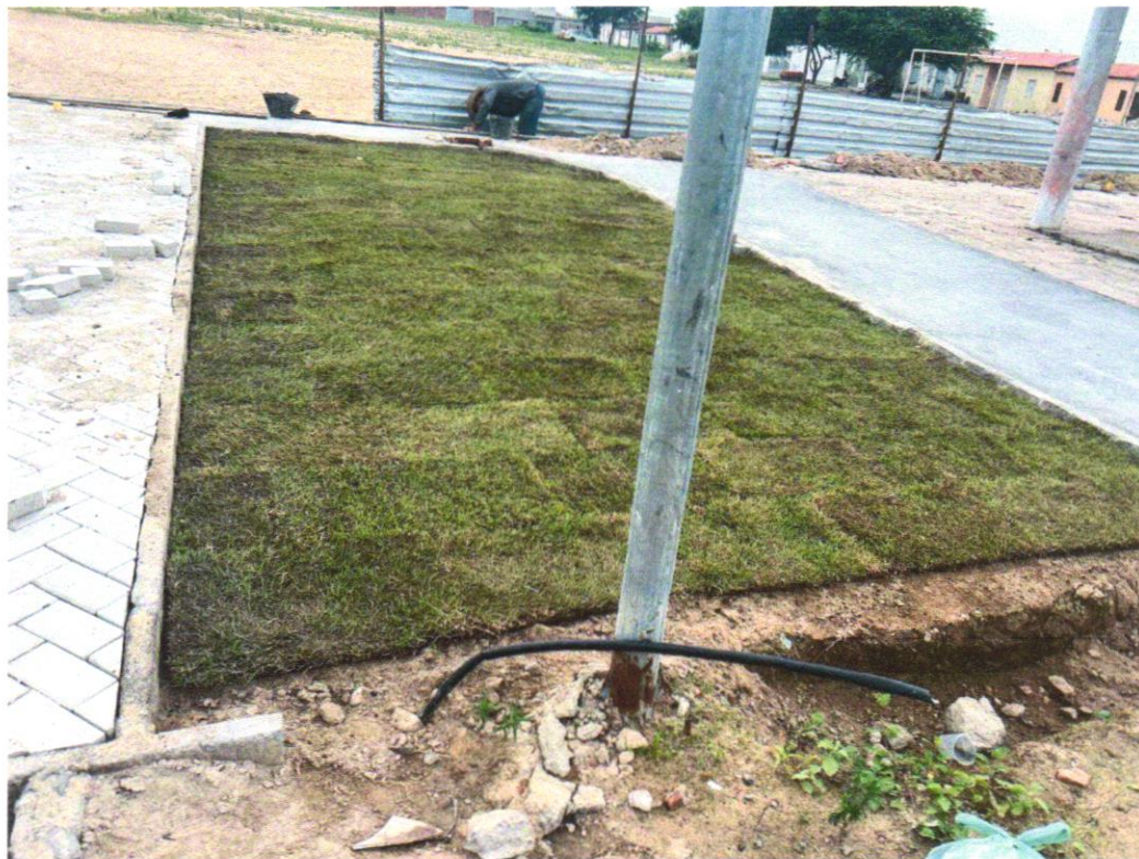
Foto 07 - Grama esmeralda em placas, fornecimento e plantio