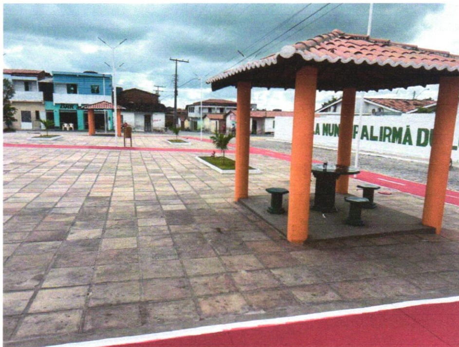
Foto 13 - Mesa c/ tampo \varnothing=1,00\text{m} em concreto armado polido sobre tubo de concreto armado \varnothing=0,40\text{m} , e 4 bancos em concreto armado \varnothing=0,40\text{m} , com pintura acrílica cor cinza grafite da Coral ou similar.