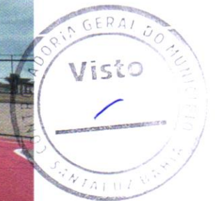
Foto 16 - TÓTEN DE INAUGURAÇÃO EM ALVENARIA COM REVESTIMENTO E PLACA INÓX

Evaldo Almeida Moraes Engenheiro Civil RNP 0514117303-3